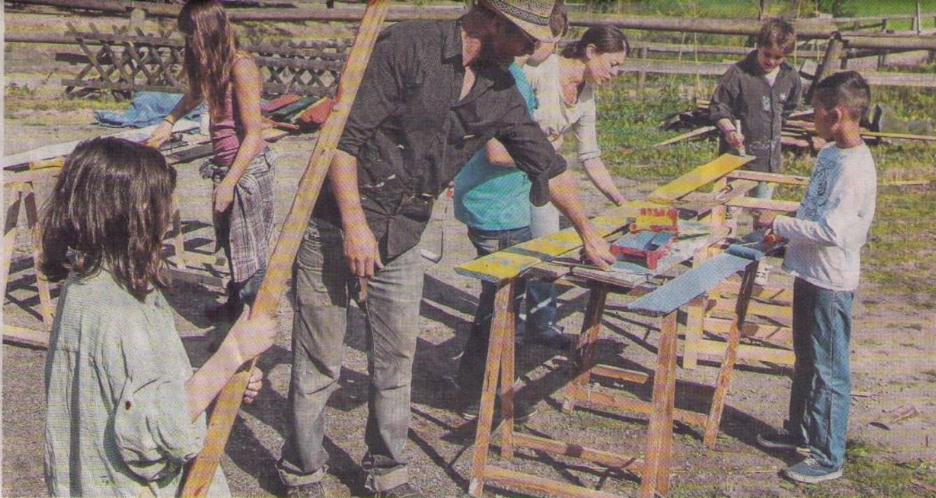
Schön bunt wurde der neue Zaun auf dem Lernbauernhof Schulte-Tigges in Derne. Sieben Kinder von psychisch kranken Eltern halfen fünf Tage lang auf dem Bauernhof mit.